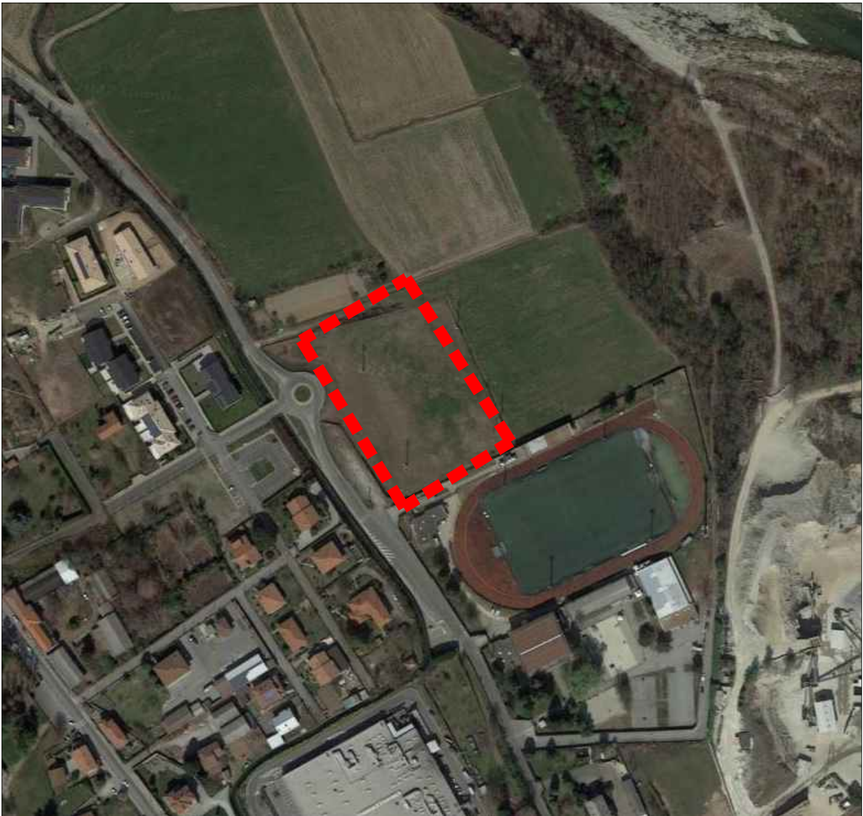
ORTOFOTO ESTRATTA DA GOOGLE MAPS